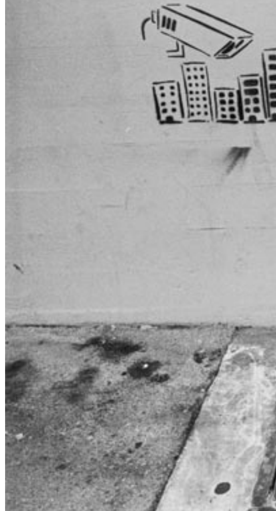
La majorité des jeunes restent des expérimenta

Je fume des joints de temps en temps dans le local à un pote, sans abuser et tout, et quelqu'un a dit à mes parents